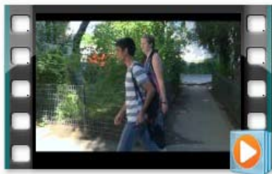
Scurtmetraj 1 - Ambasador (final - 1080 v3).mp4

VĂ INVIT PE SITE-UL WWW.DESENĂMVIITORUL.RO PENTRU VIZIONAREA FILMELOR!